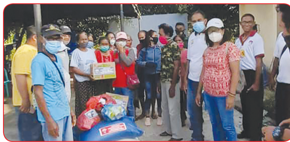
Foto bersama tim PC Lembata saat memberikan bantuan.