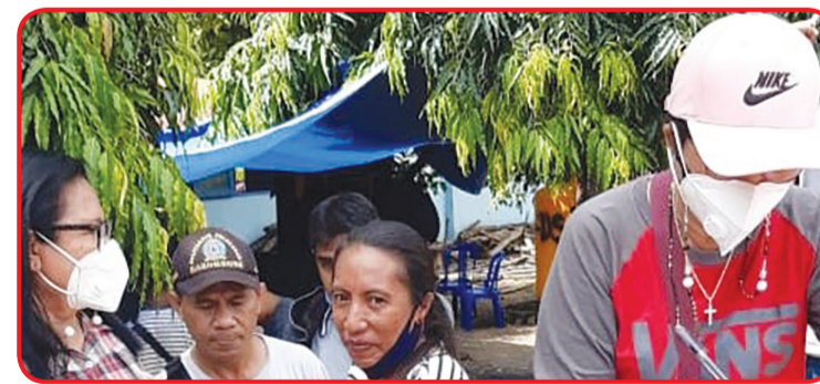
Prosesi penyerahan barang ke posko.