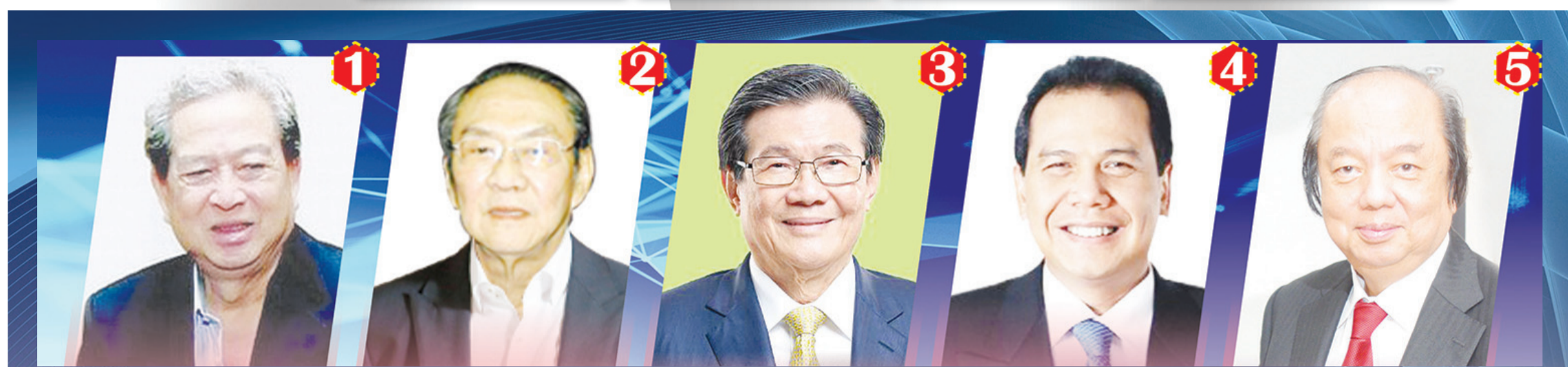
BUDI HARTONO (Nilai kekayaan 20,5 milyar dolar AS, Bisnis perbankan dan industri rokok).