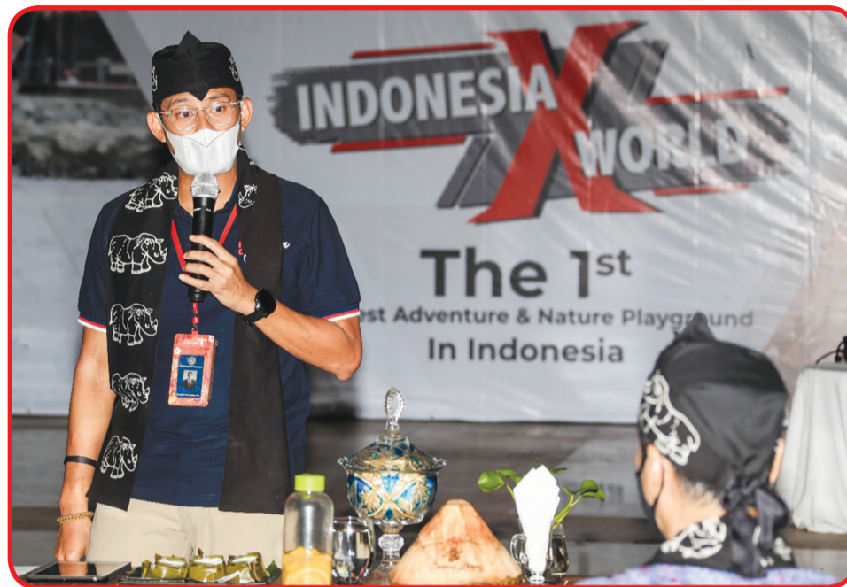
Menparekraf Sandiaga Uno saat kunjungan ke Kawasan Ekonomi Khusus Tanjung Lesung, Pandeglang, Banten.

Selain itu, tambahnya, kelebihan KEK Tanjung Lesung karena lokasi KEK Tanjung Lesung berada di dekat Jakarta. Sehingga, bagi masyarakat yang ada di Ja-