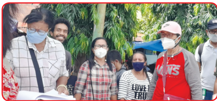
Penyerahan bantuan ke Posko - posko.

"Kami akan terus bergerak, karena banyak tempat yang harus kami kunjungi dan pantau kondisinya. Sementara kami laporan tahap awal atas bantuan dari para donator yang dihimpun Perhimpunan INTI," pungkasnya. • bam