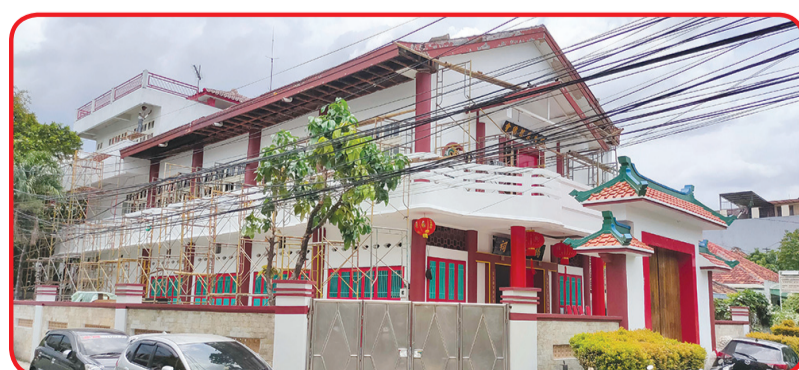
Tampak luar rumah Abu Marga Yang dalam proses renovasi.

Perbaikan yang dilakukan di rumah Abu Marga Yang ini adalah suatu upaya agar tidak terjadi kerusakan yang semakin parah akibat adanya kebocoran di langit-langit rumah Abu Marga Yang. Hal ini menarik simpati dari para anggota yang sangat berterima kasih atas ide Ketua Yayasan Marga Yang dalam memperbaiki rumah Abu Marga Yang sehingga dapat tetap terawat dan menjadi