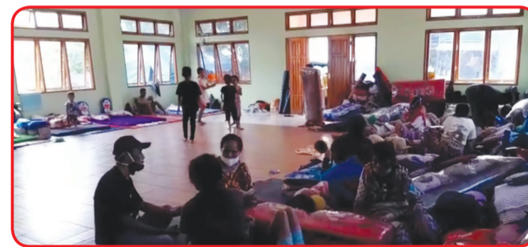
Salah satu posko pengungsian.