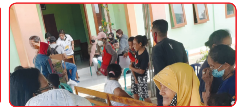
Para pengungsi ketika menerima bantuan.